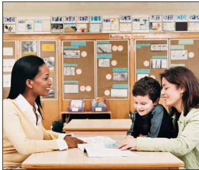
Getty Images / Digital Vision

Fuente: Marge Simic, "Eric Digest: Parent Involvement in Elementary Language Arts," Indiana University, www.indiana.edu/~reading/ieo/digests/d60.html .